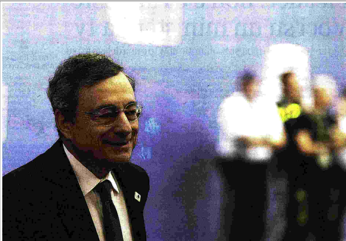
Mario Draghi, 73 anni, dopo la laurea all'Università degli Studi di Roma La Sapienza, si è specializzato al Mit di Boston. Dal 1991 al 2001 è direttore generale del Tesoro. Dopo 3 anni a Goldman Sachs, nel 2005 diventa governatore della Banca d'Italia, che lascerà per diventare presidente della Bce nel novembre 2011